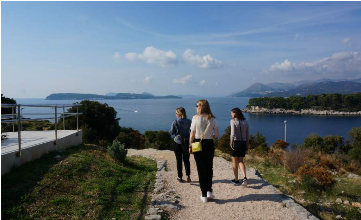
Som en bonus til et veldig interessant arrangement, var det vakre omgivelser og deilig temperatur.